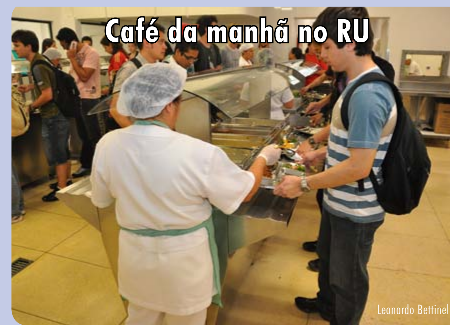
Café da manhã no RU