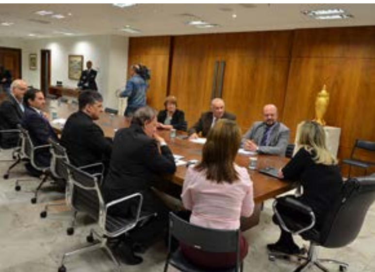
Os reitores colocaram as universidades à disposição para auxiliar na análise do projeto e de seus impactos.

Os reitores das instituições de ensino superior do Paraná que formam o chamado Quadrilátero