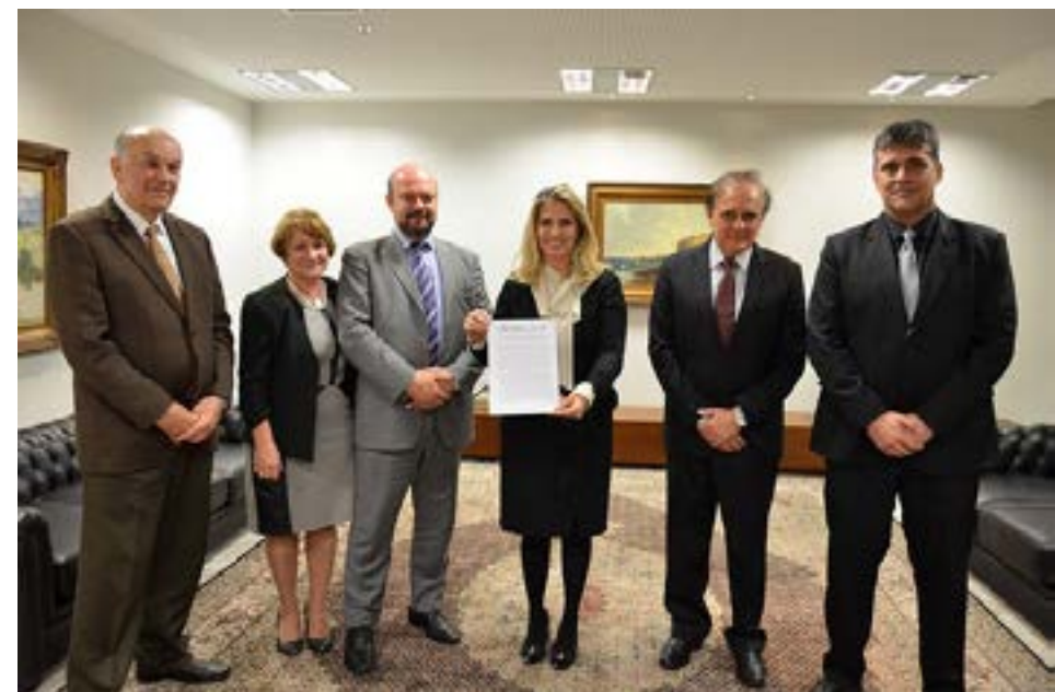
Os reitores colocaram as universidades à disposição para auxiliar na análise do projeto e de seus impactos.

rastros de prejuízos ambientais e sócio-econômicos, inclusive com possíveis deslocamentos de populações indígenas e caiçaras, além dos impactos sobre uma série de outras atividades correlatas, como turismo, comércio, cidades, patrimônio histórico e preservação da natureza.”